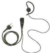
小型タイプピンマイク&イヤホン JSPRN0001 本体価格 3,800円(税抜)