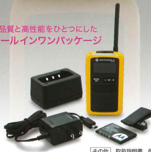
その他 取扱説明書 保証書

MS50の魅力のひとつは、オールインワンパッケージ。本体に リチウムイオン電池パック、充電器、ベルトクリップが同梱さ れていますので、パッケージを開けたその日からお使いいた だけます。線返し充電が可能なリチウムイオン電池パックは 継ぎ足し充電もでき、ランニングコストも軽減できます。