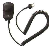
スピーカーマイク JSPMN0001 本体価格 3,600円(税抜)

※マイク/イヤホンを接続した状態で電源を入れたときに、音量が半分以上で設定されていた場合は、聴力障害防止を目的に音量が下がります設定になっています。