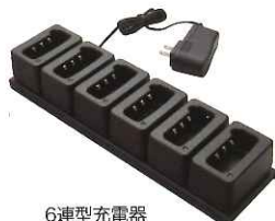
6連型充電器 (ACアダプター付) JCPCN0002 本体価格 18,000円(税抜)