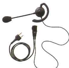
ブームマイクイヤホン JSPRN0003 本体価格 4,800円(税抜)