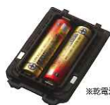
アルカリ単3乾電池ケース (2本使用) JCPLN0001 本体価格 1,600円(税抜)