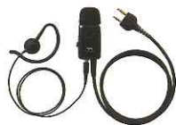
タイプピンマイク&イヤホン (マイク感度切替え付) JSPRN0002 本体価格 6,000円(税抜)