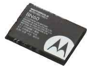
リチウムイオン電池パック (930mAh) BN60 本体価格 3,000円(税抜)

※マイク/イヤホンを接続した状態で電源を入れたときに、音量が半分以上で設定されていた場合は、聴力障害防止を目的に音量が下がります設定になっています。