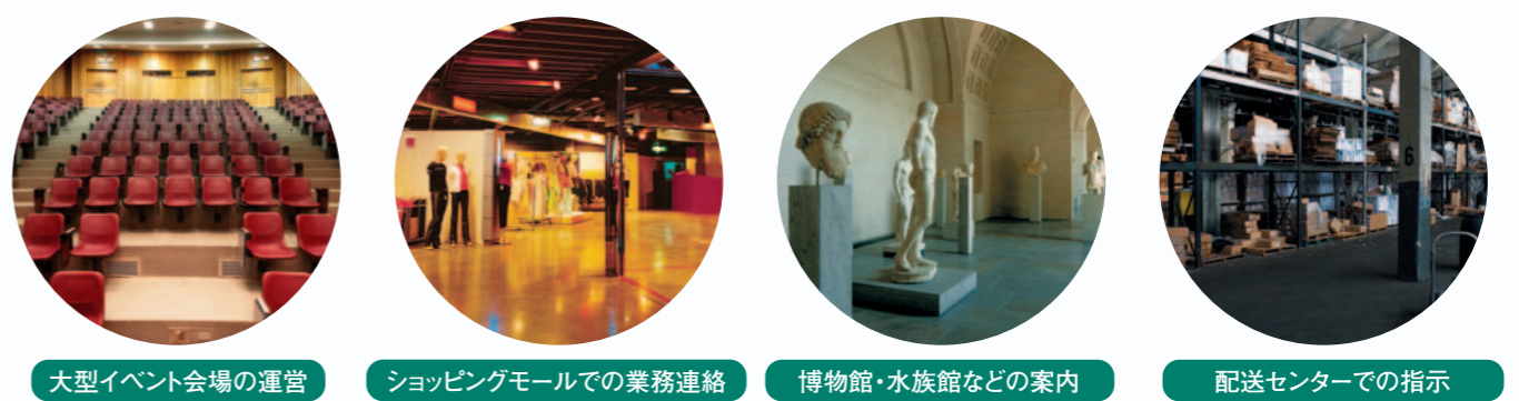
大型イベント会場の運営 ショッピングモールでの業務連絡 博物館・水族館などの案内 配送センターでの指示