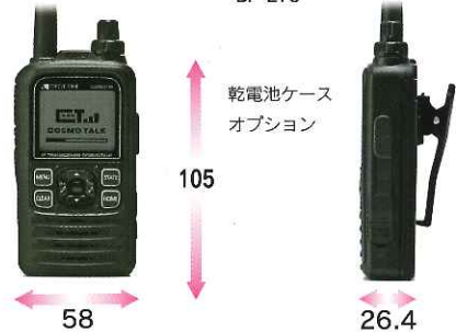
乾電池ケース オプション