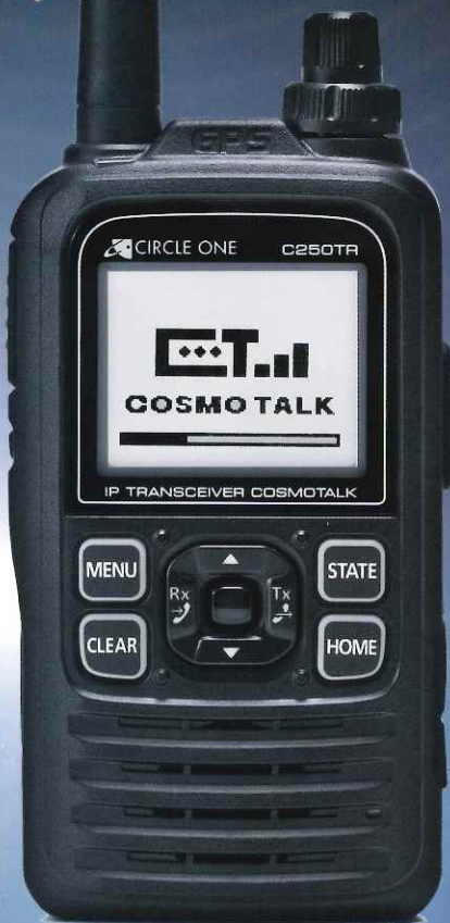
ハンディ・コスモトーク C250TR