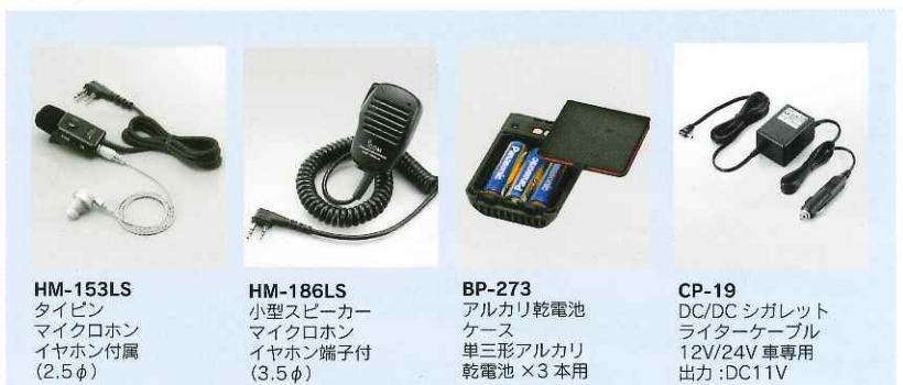
HM-153LS タイピン マイクロホン イヤホン付属 (2.5φ)