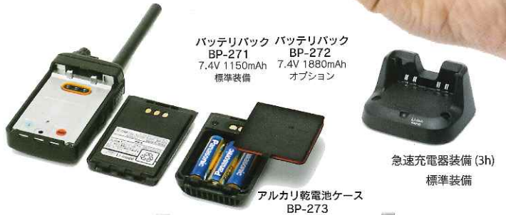
バッテリーバック バッテリーバック BP-271 BP-272 7.4V 1150mAh 7.4V 1880mAh 標準装備 オプション